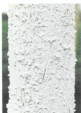
Белое защитное покрытие ствола, содержащее кварцевый песок, после нанесения

Препятствует появлению абиотических повреждений коры