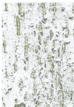
Покрытие ствола через 5 лет